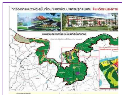
ที่มา : จังหวัดหนองคาย