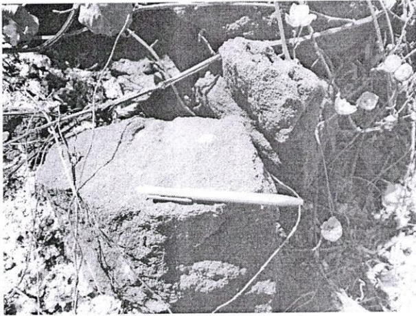
แร่เหล็ก กองที่ ๑