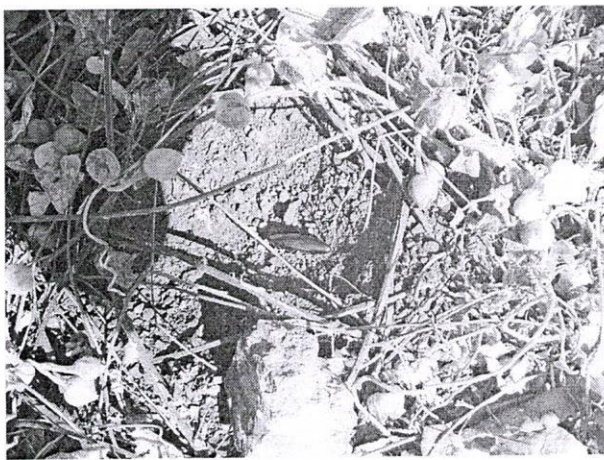
แร่เหล็ก กองที่ ๓